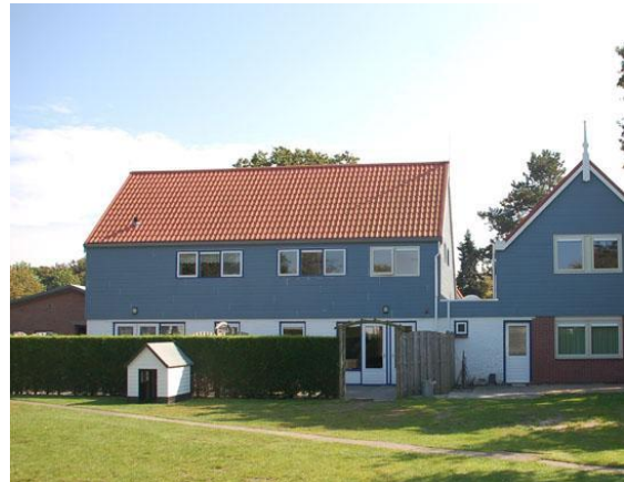
Locatie De Witte Boulevard te Renesse