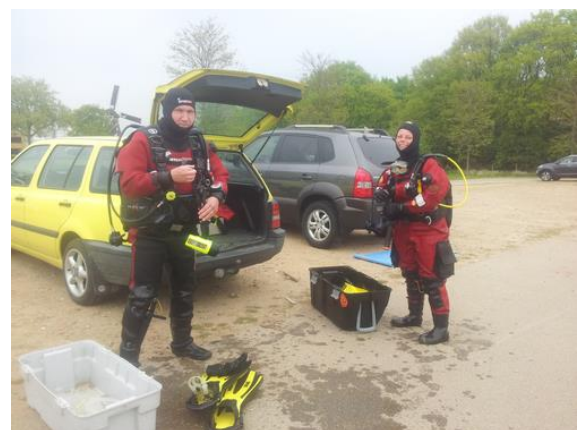
Dit duikpaar dook probleemloos samen.

Eén Bever kwam maar niet naar beneden. Oorzaak: lood in de auto laten liggen. Een andere Bever daarentegen liet een enorm zandspoor achter. Oorzaak: een defect stabjack. Zij doken niet samen.