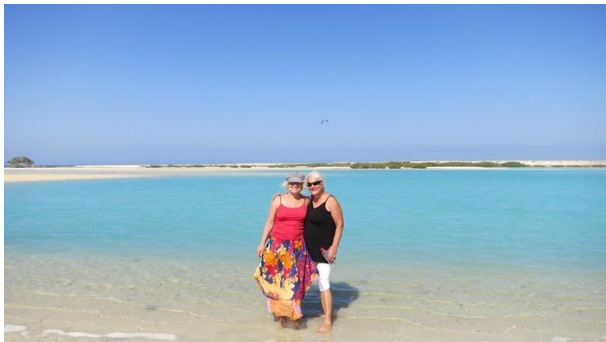
Lies en Gemmy

De duikbeleving is moeilijk in woorden over te brengen. De Acanthurus sohal is volop aanwezig. De Cheilinus undulatus wordt niet door ieder gezien, maar heeft een slaapplek op huisrif noord. De Amphiprion ocellaris blijft natuurlijk schattig om te zien. De in het Caribisch gebied zo gehate Pterois antennata is niet te missen. Vis, vis, overal vis.