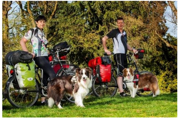
Leon, Ide, Frodo, Sam

“Het is eindelijk zover. Na meer dan een jaar voorbereiding, stappen we morgen op de fiets. De fietsen staan al klaar in de garage. We hoeven alleen nog maar op te stappen en dan HEEL VEEL rondjes met de benen draaien. Vannacht nog even in een lekker luxe bed slapen en dan begint het grote avontuur.