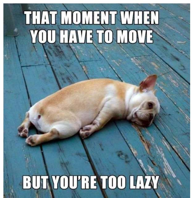
Kom nog eens meedoen, het bad is groot genoeg.

Het mag wel eens gezegd worden: die trainingen zijn erg goed om in conditie te blijven, je zwem- en duiktechniek te onderhouden en op een leuke ongedwongen manier met je clubmaten actief te zijn. Hulde aan de trainers!