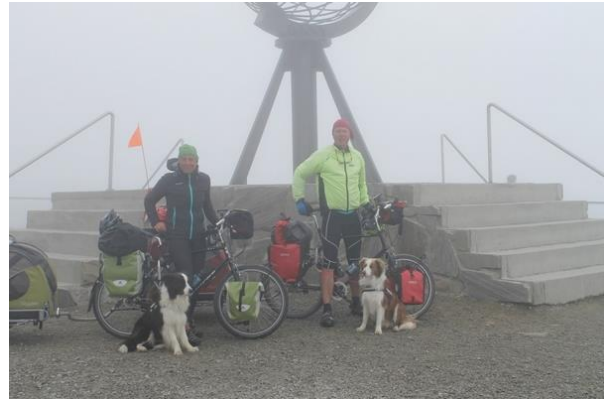
Op de Noordkaap

We willen iedereen dus ons gesteund heeft en gevolgd bedanken voor het enthousiaste mee leven met onze reis.